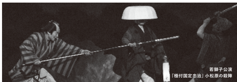
若獅子公演 『極付国定忠治』小松原の殺陣