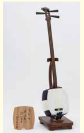
二代目野澤喜左衛門使用 三味線