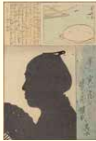
『くまなき影』 河竹其水(黙阿弥) 芳幾画